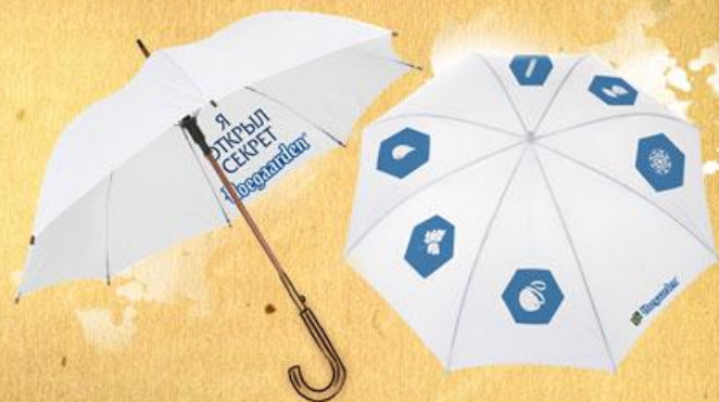
ЗОНТ (С ПРОЯВЛЯЮЩИМСЯ РИСУНКОМ ОТ ВОДЫ) 40 КОДОВ