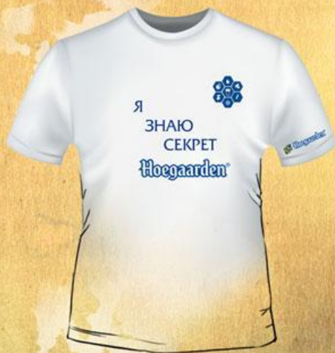
ФУТБОЛКА (С ПРОЯВЛЯЮЩЕЙСЯ НАДПИСЬЮ) 30 КОДОВ