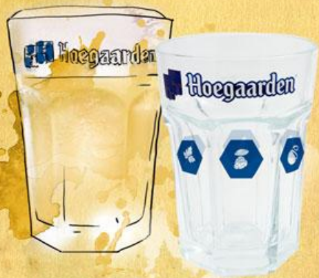
БОКАЛ (С ПРОЯВЛЯЮЩИМИСЯ СИМВОЛАМИ ОТ ХОЛОДА) 20 КОДОВ

УНИКАЛЬНЫЕ ГАРАНТИРОВАННЫЕ ПОДАРКИ С ПРОЯВЛЯЮЩИМИСЯ НАДПИСЯМИ, РАСКРЫВАЮЩИМИ СЕКРЕТ HOEGAARDEN