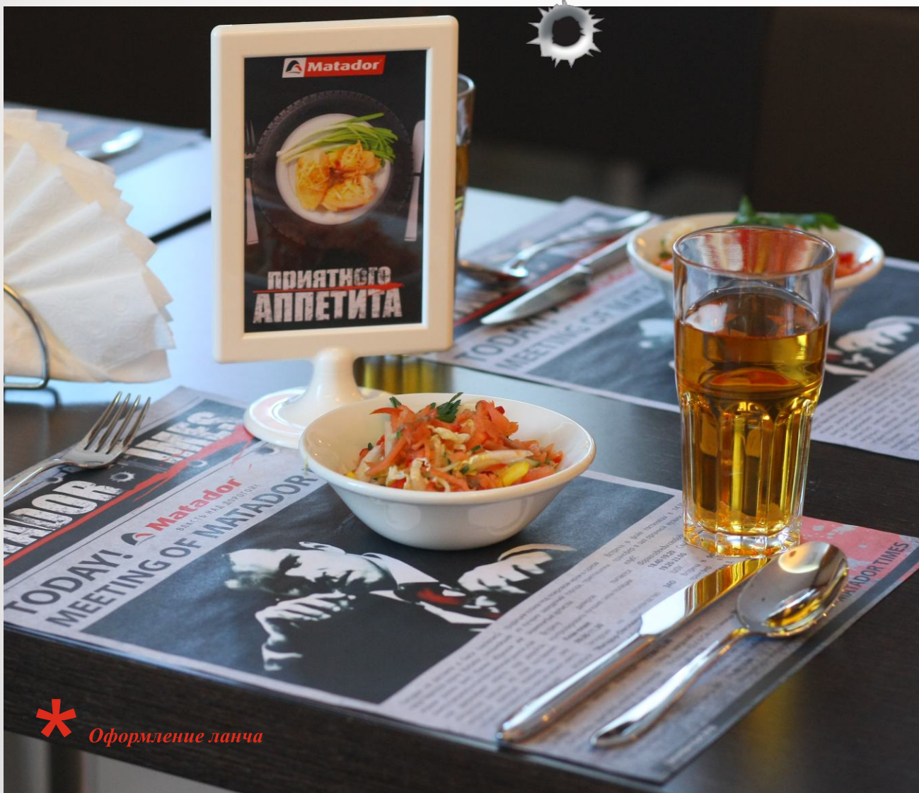
* Оформление ланча