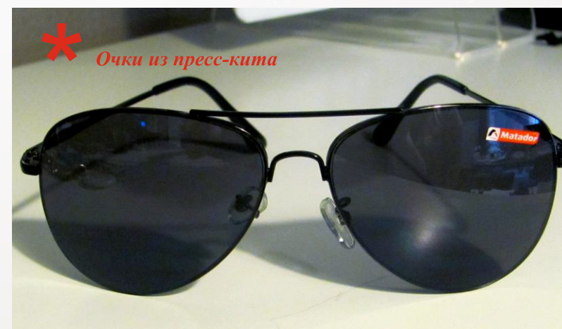
* Очки из пресс-кита